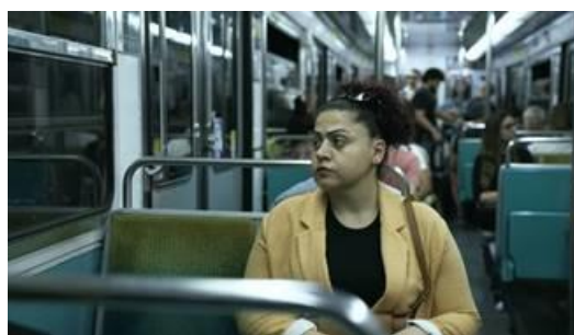
Format : 27mn Réalisation : Dana Alboz

Le 21 août 2013, une attaque chimique au gaz sarin est perpétrée dans la région de la Ghouta orientale au nord-est de la capitale syrienne, Damas, causant plus de 1400 morts. Cette attaque, attribuée au régime syrien de Bashar Al Assad, sera un tournant dans la guerre en Syrie. Malgré une « ligne rouge » fixée par le Président américain Barack Obama, elle ne donnera lieu à aucune intervention internationale. Ce crime demeure impuni.